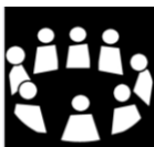
(bijlage 1)